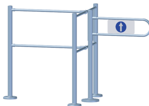
Установка K11T рядом с ограждением