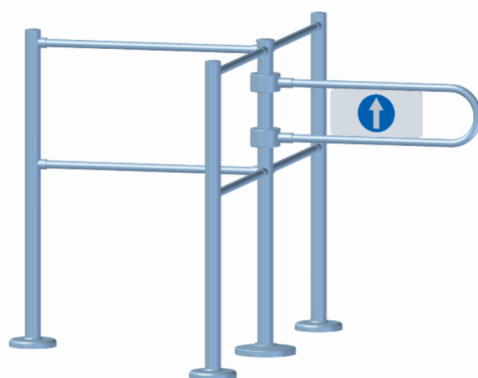
Соединение K11K с ограждением