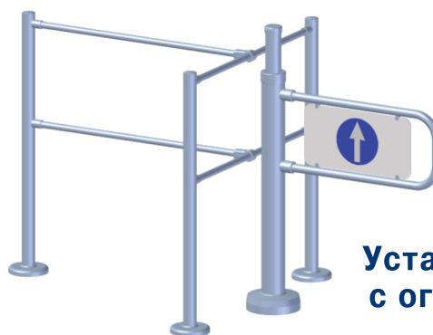
Установка рядом с ограждениями