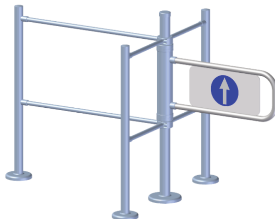
Соединение с ограждениями